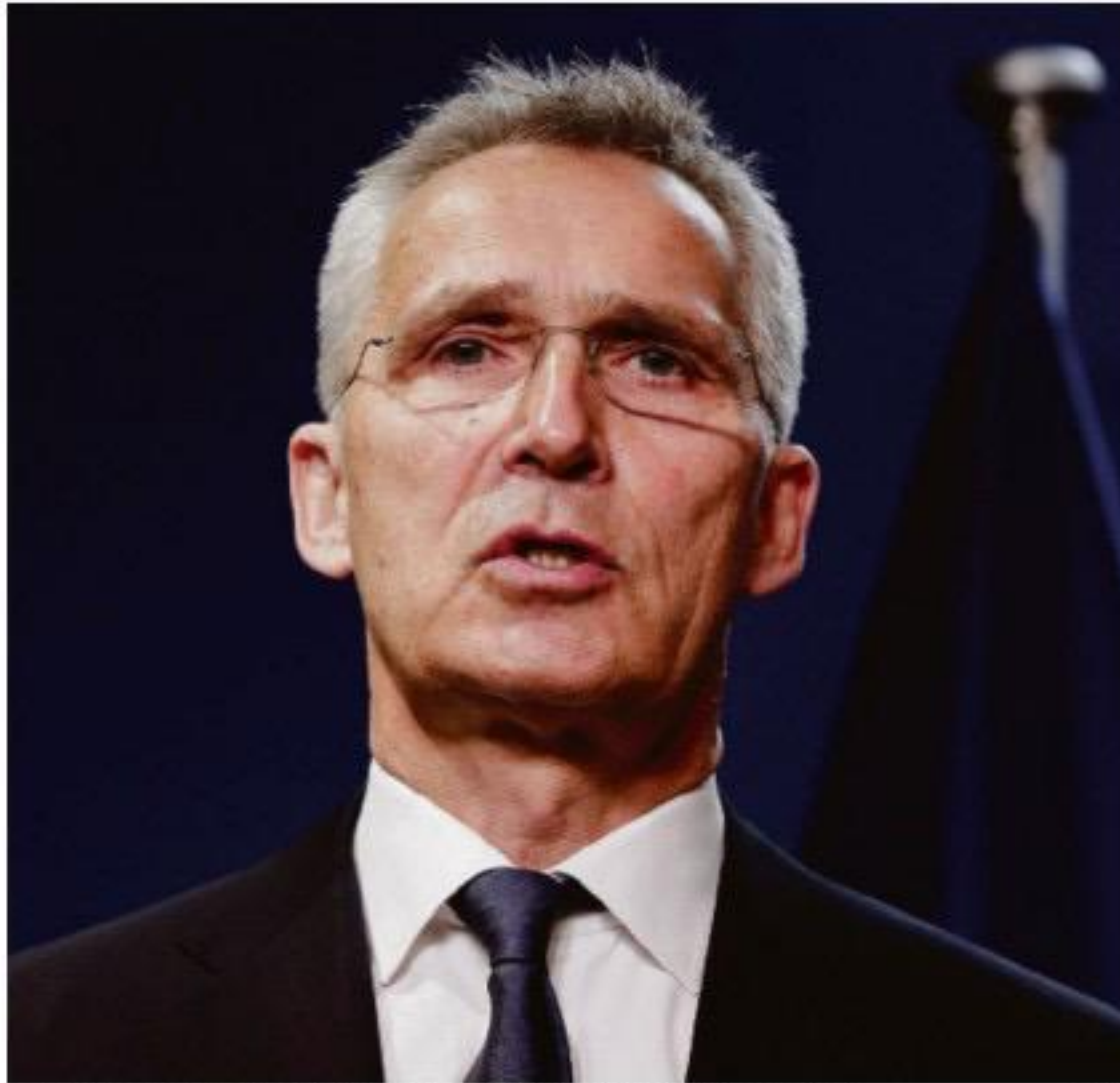
A CARTE SCOPERTE Jens Stoltenberg, 63 anni, segretario generale della Nato

Il fatto più rilevante della giornata è rappresentato dalle dichiarazioni rilasciate dal Segretario generale della Nato, Jens Stoltenberg , che è intervenuto così alla conferenza finale della riunione dei ministri degli Esteri dei Paesi Nato che si tiene a Berlino: «L'Ucraina può vincere questa guerra e la Nato è più forte e unita di sempre. La Russia non sta raggiungendo gli obiettivi strategici che si è posta». A lui ha fatto eco uno dei vicesegretari della Nato, Mircea Geoana : «Il messag-